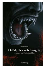
Nils Ahnland Odöd, blek och hungrig – vampyren i bok och film . BTJ förlag, 2009.

Odöd, blek och hungrig – vampyren i bok och film består av två huvuddelar. Den första delen tar upp definitioner av vampyrlitteratur- och film, samt ger en etymologisk förklaring av vad en vampyr är. Vidare presenteras vampyren i myter, folktro och verklighet. Ahnland försöker också att förklara varför människor trott på vampyrer och varför man ägnat sig åt vampyrforskning. Därefter följer en genrehistorik som tar sin utgångspunkt i 1700-talet, i såväl gotiska romaner som i lyrik. Slutligen listas vampyrens kännetecken och motiv i vampyrlitteratur/film i denna första del, som allt som allt utgör cirka en fjärdedel av det totala omfånget. Resten av boken ägnas åt korta presentationer av böcker och filmer med vampyrmotiv. Dessa komplet-