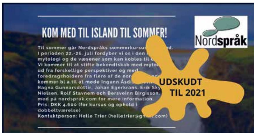
Nordspråks sommarkurs är uppskjuten till 2021.